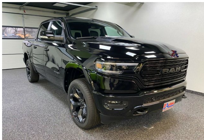
AUTEC AUTOMOTIVE GMBH